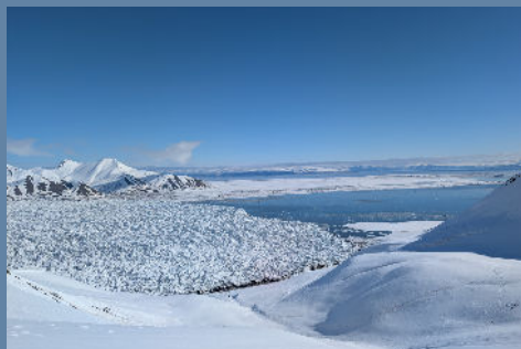
SILENCE ET GRANDEUR