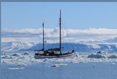
NOTRE CAMP DE BASE FLOTTANT

CETTE ÎLE MAGIQUE, SITUÉE AU CŒUR DE L'ARCTIQUE, REGORGE DE MERVEILLES NATURELLES, DE PAYSAGES À COUPER LE SOUFFLE ET D'UNE FAUNE SAUVAGE ABONDANTE. LE VOYAGE SERA BIEN PLUS QU'UNE SIMPLE ESCAPADE EN MONTAGNE. C'EST UNE IMMERSION TOTALE DANS UN MONDE OÙ LE TEMPS SEMBLE S'ÊTRE ARRÊTÉ ET OÙ LA NATURE RÈGNE EN MAÎTRE. IMAGINEZ-VOUS GLISSER SUR DES BELLES PENTES, ENTOURÉ PAR LES MONTAGNES, LES GLACIERS ET LA MER. AVEC LA POSSIBILITÉ DE VOIR DES PHOQUES, DES RENNES, DES MORSES ET MÊME PEUT ÊTRE DES OURS POLAIRES